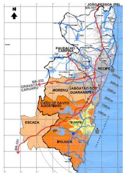
Área de abrangência do Território Estratégico de Suape